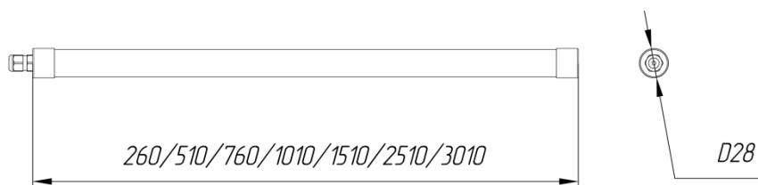
Возможные КСС светильника